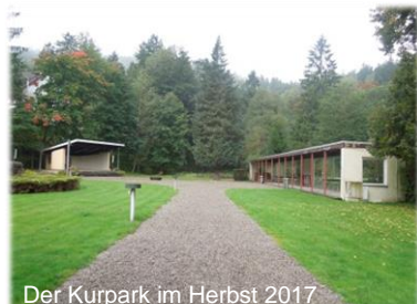
Der Kurpark im Herbst 2017

Als erstes Projekt wurde die Erneuerung und Attraktivitätssteigerung des Kurparks in Lautenthal beschlossen. Vorgestellt wurde das Projekt vom 2. Vorsitzenden des Vereins „Bürgerbad Bergstadt Lautenthal e.V.“. Der Verein hat vor Jahren die Unterhaltung und