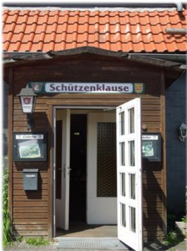
Offene Türen für alle in Zellerfeld

ßen. Ein ungefährliches und völlig munitionsfreies Angebot wird durch die Einrichtung eines Schießkinos geschaffen, wodurch insbesondere Jugendliche für den Sport begeistert werden können.