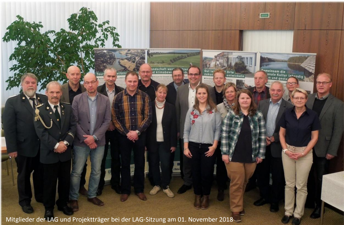
Mitglieder der LAG und Projekträger bei der LAG-Sitzung am 01. November 2018

und neue Zielgruppen, barrierefreie Angebote, Erlebnisorientierung und Digitalisierung, um dem stark wachsenden Wettbewerb im Tourismus standzuhalten. Die LAG sah besonders die spätere Umsetzung der Maßnahmen als wichtig an. Das Konzept schafft die Grundlage dafür und soll mit rund 20.700 Euro LEADER-Förderung unterstützt werden.