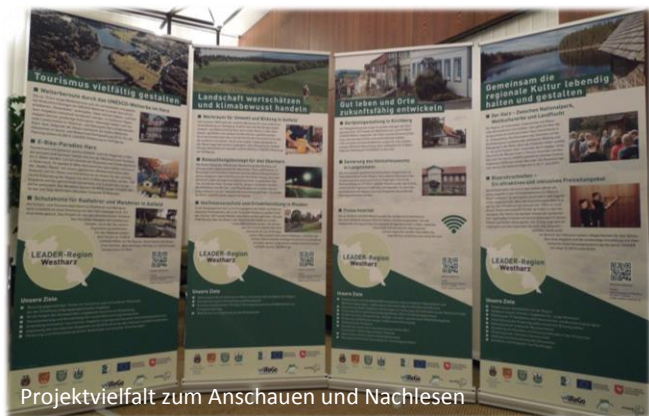
Projektvielfalt zum Anschauen und Nachlesen

Seit November ist eine kleine Wanderausstellung zu den bereits erzielten Erfolgen in der Region unterwegs. Es werden bereits umgesetzte oder in der Umsetzung befindliche Projekte aus den verschiedenen Handlungsfeldern vorgestellt. Die Ausstellung macht die Vielfalt der Vorhaben und damit der Möglichkeiten von LEADER deutlich. Wer seine Projektidee in dieser Vielfalt wieder findet, kann sich ergänzende Informationen zu den Fördermöglichkeiten im Flyer oder in der ausführlicheren Broschüre holen oder sich direkt an das Regionalmanagement wenden. Derzeit stehen die „Roll Ups“ im Rathaus der Stadt Langelsheim. Vielleicht treffen Sie die Ausstellung auf ihrer Wanderung ja auch mal in Ihrem Ort.