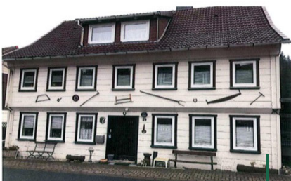
Tür in Seesen