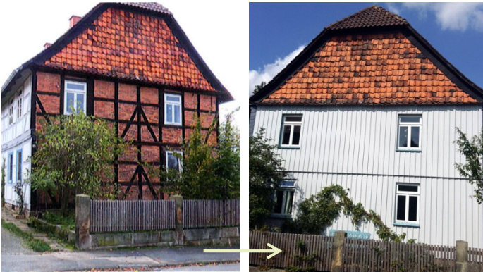
Fassaden in Langelsheim